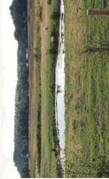
I området runt våtmarksparken betar får.

Runt våtmarksparken går ett 3, 5 kilometer långt motionsspår, med belysning nästan hela vägen. Från gångvägarna kan mycket av fågel- och djurlivet observeras. Fågeltornet vid Håberget ger god utsikt över området. Grillplatsen är öppen för allmänheten och här finns ved för eldning. Sittbänkar finns på flera ställen i parken.