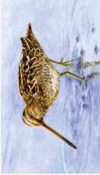
Enkelbeckasinen tris i vattnet i Hökälla. Illustration: Agnes Danielsson

i området. I dammarna finns det gott om fisk som gädda, mört, björkna, brax och ål. Här har också de mycket sällsynta vattenväxterna knöl- och spetsnate planterats in.